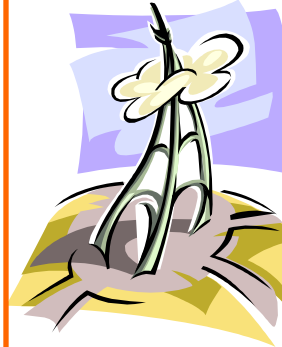
Caption describing picture or graphic.

“Mae mynd i Goleg y Bala yn brofiad mawr ac yn llawer o hwyl.”